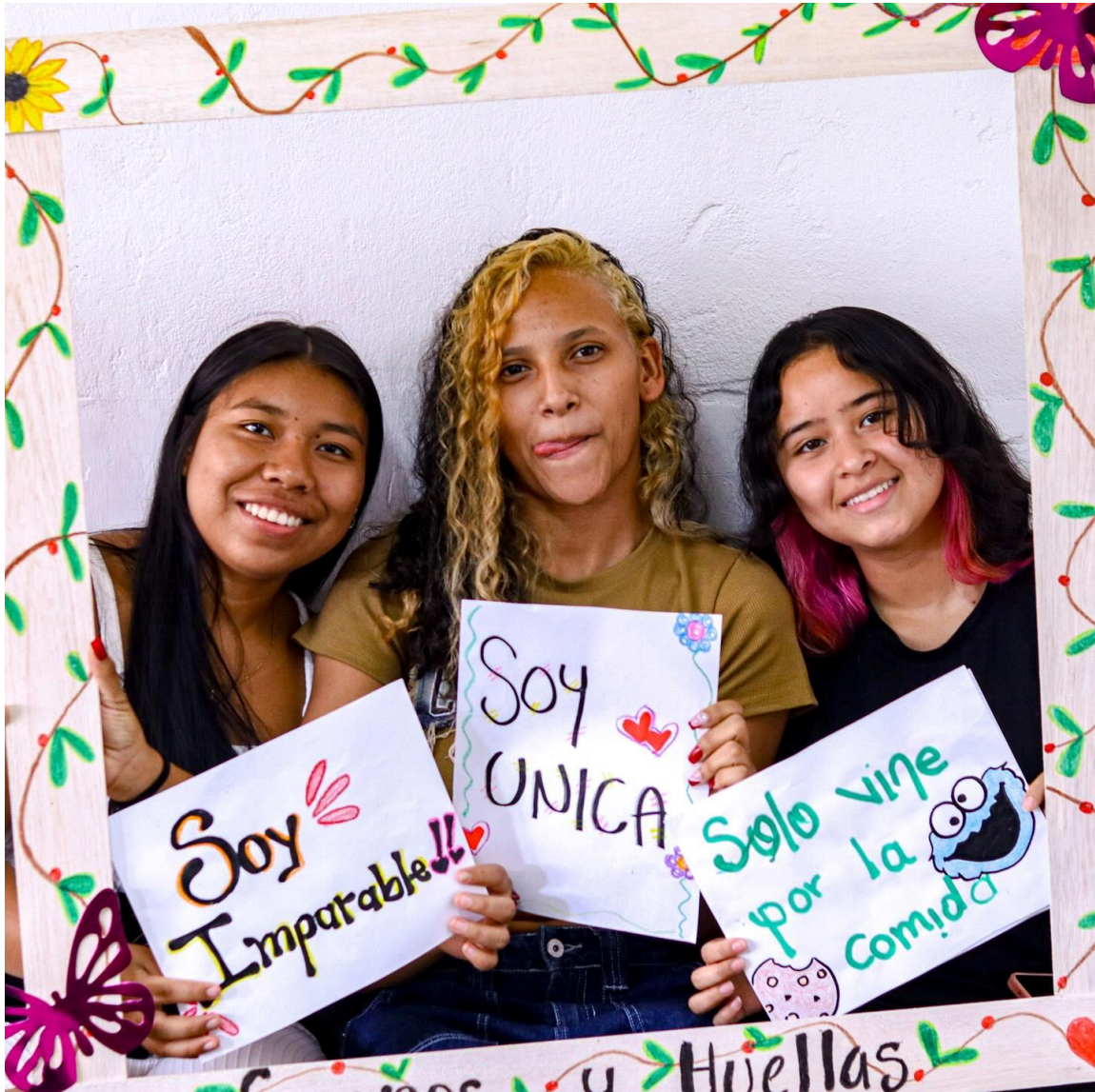
Blijde gezichten na weer een workshop!